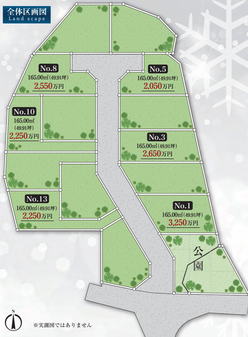
※実測図ではありません